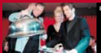
8 Manfield onthult door Frans Molenaar ontworpen schoenen