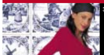
3 Campagne met een knipoog bij Dolcis