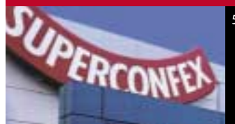
5 Kansen voor Superconfex in België