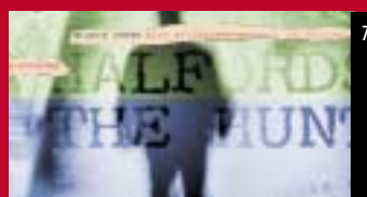
7 Halfords lanceert 'Hunt'-concept voor actieve klantbenadering