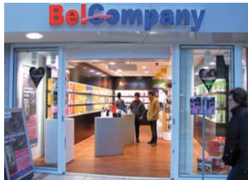
Marktleider mobiele telecom NL