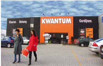
Grootste woningdiscounter in Benelux.