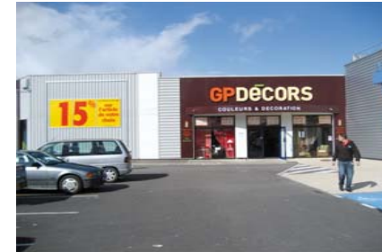
Woningdecoratie specialist in Frankrijk.