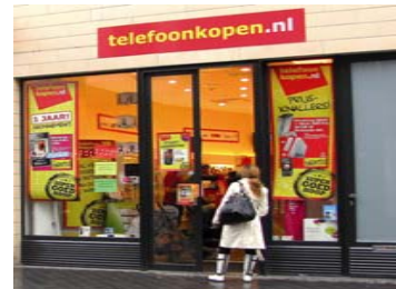
De scherpste aanbiedingen in mobiele telefonie