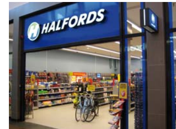
Grootste retailer van NL in fietsen, fiets- en autoaccessoires, car-audio en navigatie